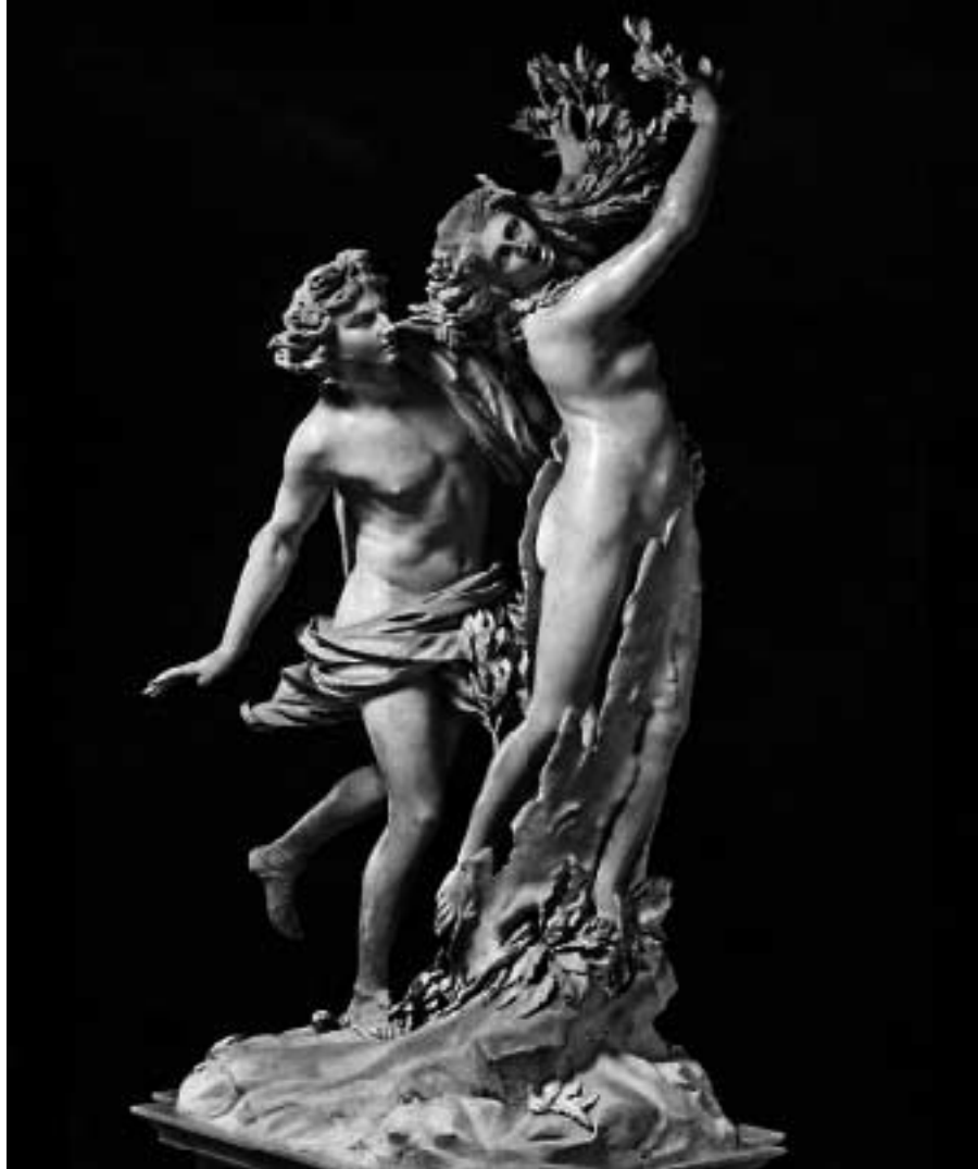
Dafne e Apollo - Bernini